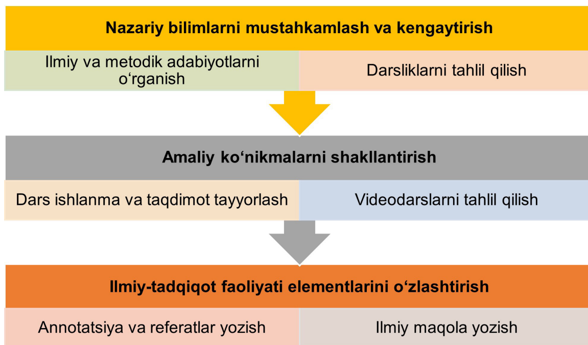
2-rasm: Mustaqil ta'limni tashkil qilish bosqichlari

Yuqoridagilarni hisobga olib, quyidagi chizmani taqdim etamiz (2-rasmga qarang).