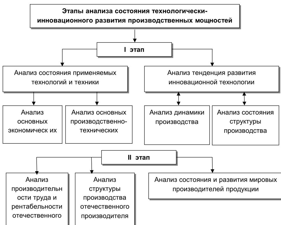
Рис. 1: Этапы анализа и развития технологических инноваций.

Развивающиеся страны используют приобретение иностранных технологий для решения приоритетных научно-технических задач, сокращения импорта и расширения экспорта. Одновременно они стремятся к развитию собственного научно-технического потенциала, что позволяет разрабатывать новые технологии с учётом национальных условий, а также продавать лицензии и суб-лицензии на международном рынке. Опыт Японии подтверждает эффективность стратегии развития технологического экспорта на основе закупки лицензий, которая в долгосрочной перспективе обеспечивает высокий уровень экономической отдачи (Рис. 1).