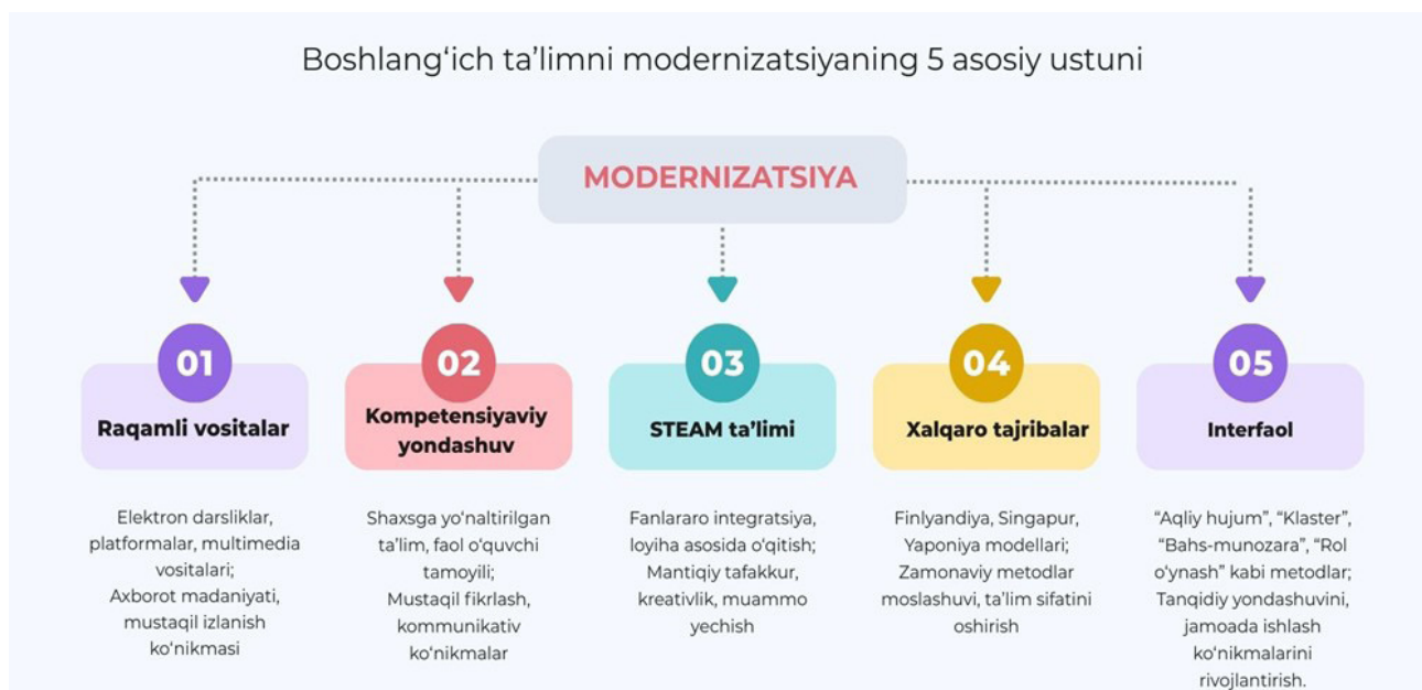
1-rasm: Boshlang'ich ta'limni modernizatsiya qilishning asosiy yo'nalishlari

STEAM (Science, Technology, Engineering, Arts, Mathematics) dasturi boshlang'ich ta'limda o'quvchilarning integratsiyalashgan bilim va ko'nikmalarini rivojlantirishga qaratilgan innovatsion pedagogik yondashuv hisoblanadi. Ushbu dastur fanlararo bog'liqlikni ta'minlab, o'quvchilarda mantiqiy tafakkur, ijodiy fikrlash, muammolarni hal etish va amaliy ko'nikmalarni bir vaqtning o'zida shakllantirishga xizmat qiladi. STEAM dasturining asosiy afzalligi shundaki, u o'quvchilarga bilimni alohida fanlar doirasida emas, balki kundalik hayotiy vaziyatlarda qo'llash imkonini beradi, bu esa o'quv jarayonini interfaol va qiziqarli qiladi. Shu bilan birga, STEAM yondashuvi raqamli texnologiyalar va loyihalashtirish metodlarini birlashtirgan holda o'quvchilarning kreativ va innovatsion salohiyatini oshirishga yordam beradi hamda ularni kelajakdagi kasbiy va ijtimoiy faoliyatga tayyorlaydi, deb aytish mumkin.