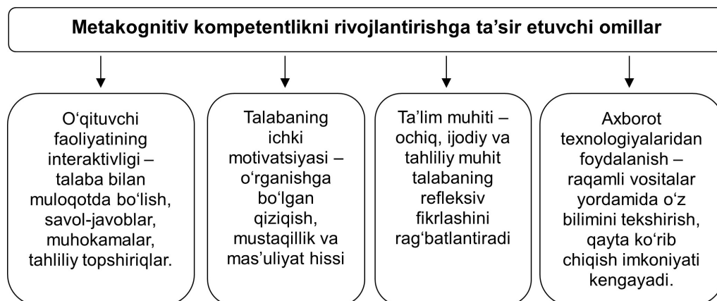
2-rasm: Talabalarda metakognitiv kompetentlikni rivojlantirishga ta'sir etuvchi omillar

Mazkur omillar o'zaro uyg'unlashganda, metakognitiv o'qish ko'nikmalari samarali shakllanadi. Metakognitiv o'qish ko'nikmalari quyidagilarni o'z ichiga oladi: