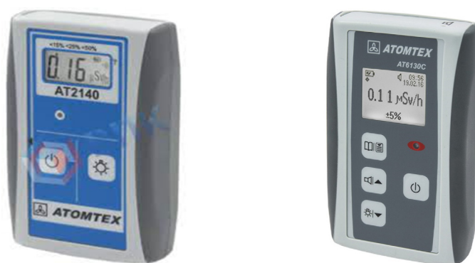
2-rasm: Radiatsion fonn o'lchaydigan DKG-AT 2140 dozimetri, MKS-AT 6130S dozimetr-radiometri

Radiatsion fonning inson organizmiga ta'siri uning darajasiga, ta'sir etish davomiyligiga va insonning individual xususiyatlariga bog'liq. Radiatsion fonning ijobiy ta'sirlariga onkologiya sohasida qo'llaniladigan radioterapiya usullari, ya'ni saraton hujayralarini yo'q qilish maqsadida yuqori dozadagi radiatsiyadan foydalanish, shuningdek tibbiyotdagi diagnostik metodlar – rentgen va kompyuter tomografiyasi (KT) tekshiruvlarini kiritish mumkin. Radiatsion fonning salbiy ta'sirlariga esa uzoq muddat davomida yuqori dozali radiatsiyaga duchor bo'lish natijasida saraton kasalliklarining rivojlanish xavfi ortishi, genetik o'zgarishlar, ya'ni radiatsiyaning DNK strukturasi zarur yetkazishi hamda radiatsiya bilan bog'liq xavotirlarning inson psixologiyasiga sezilarli ta'sir ko'rsatishi kiradi.