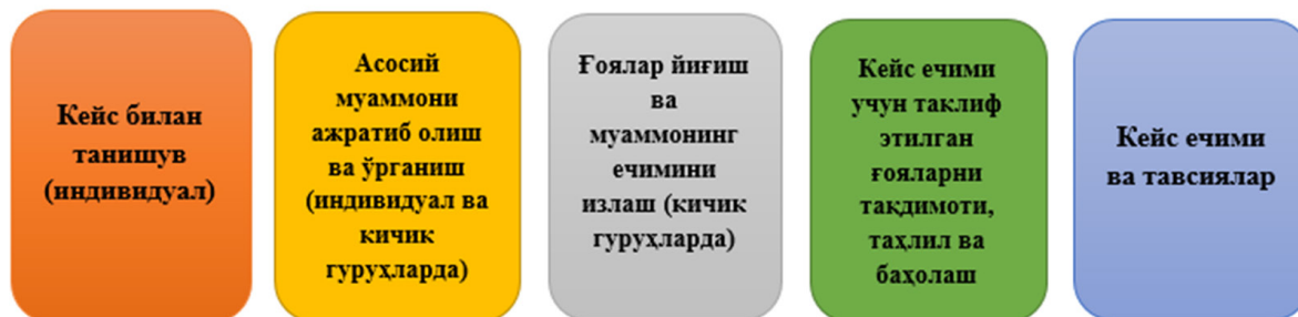
1-rasm: "Keys-stadi" metodining tuzilishi

xususiyatlari va kamchiliklari o'rganib chiqiladi hamda yagona qarorga kelinadi; uchinchi bosqichda esa talabalar bajarilishi lozim bo'lgan amallarning taqdimotini tayyorlaydilar, buning uchun 20 daqiqa vaqt ajratiladi; metod yakunida har bir guruhning taqdimoti tinglanadi, shundan so'ng guruhlararo muloqot o'tkaziladi, talabalarning yutuq va kamchiliklari ko'rsatilib, yechimlarni umumlashtirish bo'yicha har bir guruhdan bir vakil chiqishi so'raladi, "Keys-stadi" yechimi bo'yicha yakuniy xulosa o'qituvchi tomonidan beriladi.