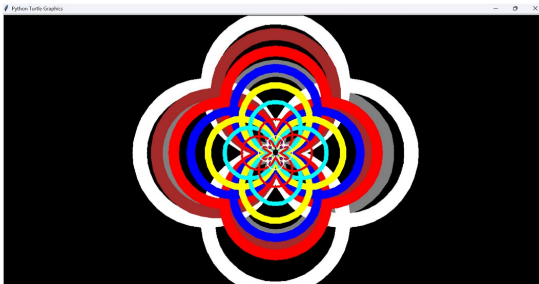
1-rasm: Bir nechta aylanadan gul hosil qilish

ircle(60);rt(90);circle(60) pencolor("red");pensize(5);circle(43);rt(90);circle(40); t(90);circle(40);rt(90);circle(40) pencolor("white");pensize(2);circle(20);rt(90);circle(20); t(90);circle(20);rt(90);circle(20) exitonclick()