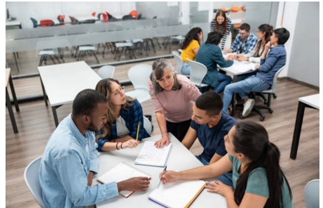
1-rasm: Guruh dinamikasi ta'lim jarayonida.