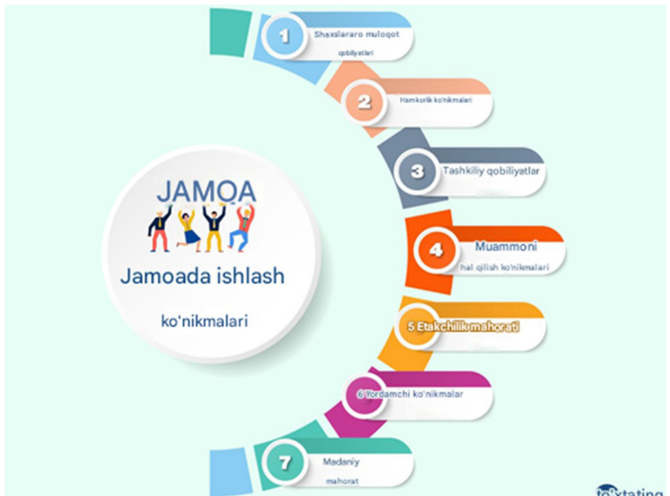
2-rasm: Ijtimoiy ta'lim usuli