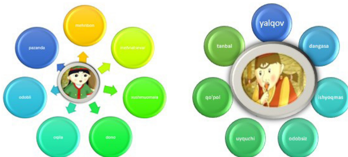
2-rasm: Zumrad va Qimmat obrazlari Klaster usulida

Hammaning sevimli ertak qahramonlari Zumrad va Qimmat obrazlarining xislatlari "Klaster usuli" dan foydalanilgan holda ijobiy va salbiy xususiyatlarga ajratib sanab chiqildi.