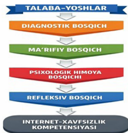
1-rasm: Talaba-yoshlarda internet-risklarning oldini olishning bosqichma-bosqich pedagogik modeli