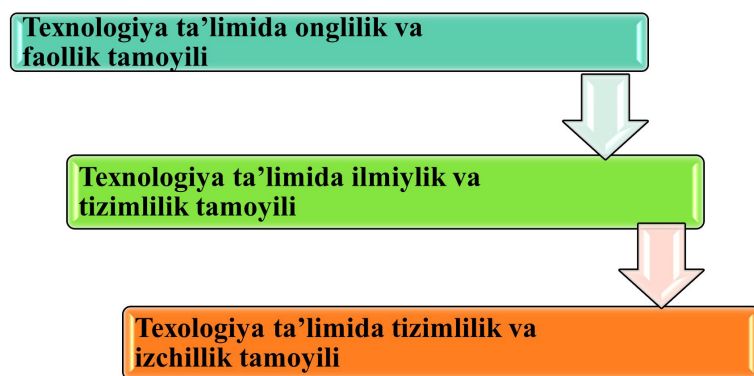
3-rasm: Ta'lim mazmunini shakllantirish tamoyillar Texnologiya ta'limida onglilik va faollik tamoyili

Talabalar tikuvchilikka oid kreativligini rivojlantirishi uchun qilayotgan ish mazmunini yaqqol tasavvur qilgandagina ishga ongli ravishda kirishadi. Bu tamoyil talabalarni tikuvchilikka oid kreativligini rivojlantirishda ilmiy bilimlarni hamda ularni amalda qo'llash metodlarini ongli va faol egallab olishni talab qiladi, shuningdek, ularda ijodiy tashabbuskorlik va o'quv faoliyatida mustaqillik, tafakkur, nutq rivojlanadi. Talabalarni tikuvchilikka oid kreativligini rivojlantirishdagi onglilik tamoyili ta'lim jarayonining aniq maqsadlarini tushunish, o'rganilayotgan dalil, hodisa, jarayonlar va ular o'rtasidagi bog'lanishni tushungan holda o'zlashtirib olish, o'zlashtirilgan bilimlarni amaliy faoliyatda qo'llay bilish kabi me'yorlarni anglatadi.