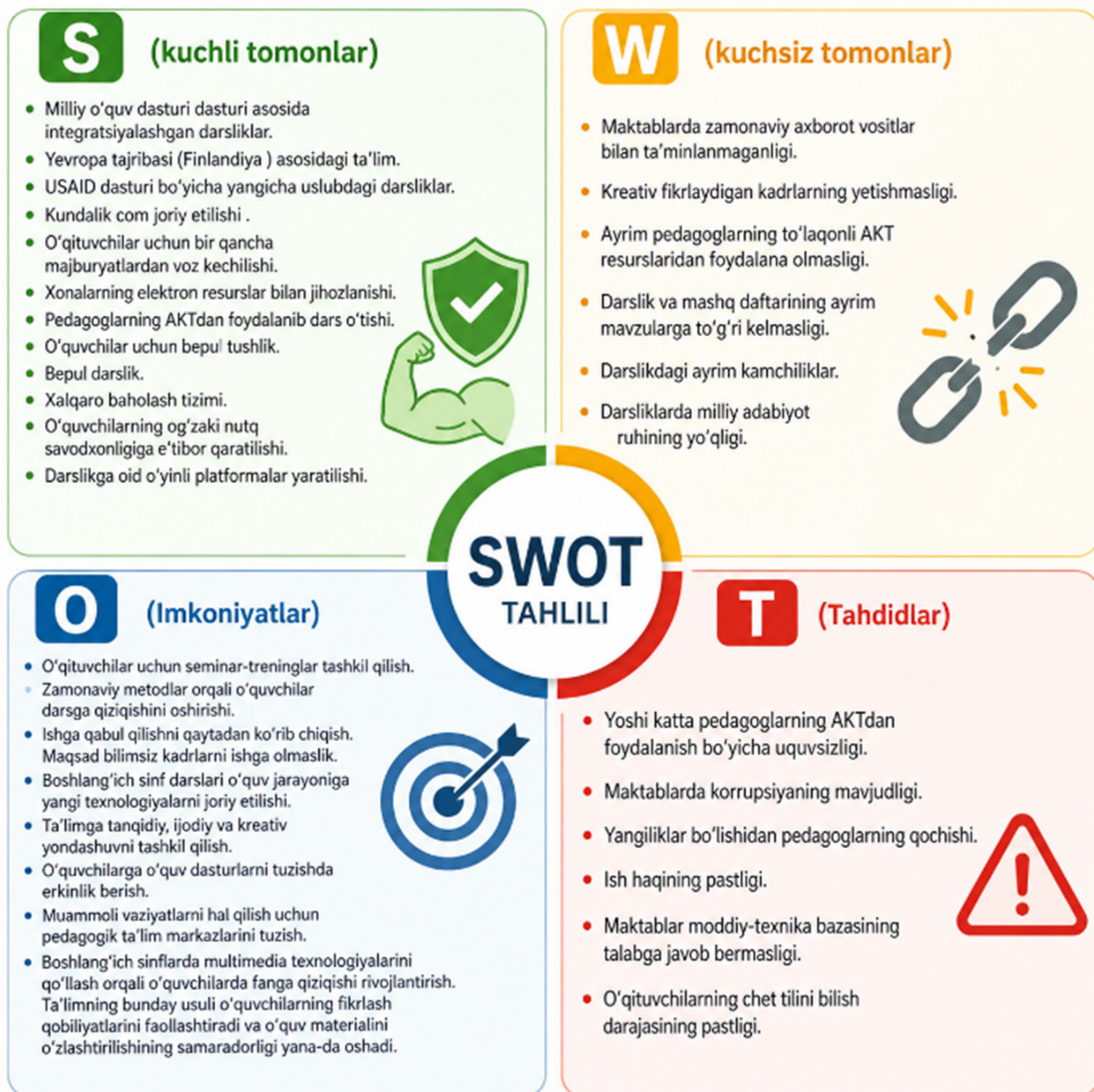
2-rasm: Zamonaviy boshlang'ich ta'limda SWOT tahlil modeli