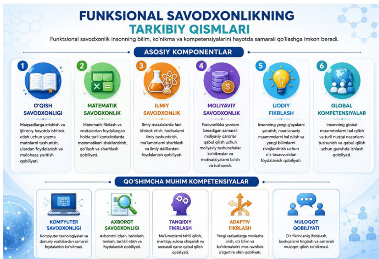
3-rasm: Funksional savodxonlikning tarkibiy qismlari

Bundan tashqari, o'quvchilarning funksional savodxonligini oshirish maqsadida turli xil o'quv-tarbiyaviy tadbirlar hamda ekskursiyalarni tashkil etish maqsadga muvofiq hisoblanadi. Funksional savodxonlikni ta'lim jarayoniga samarali integratsiya qilish orqali o'quvchilarga atrofda dunyoni anglash, savollarni shakllantirish va ularga tanqidiy yondashish imkoniyati yaratiladi. Bu esa ularning kelajakda mustaqil fikrlaydigan, ijtimoiy faol hamda raqobatbardosh shaxs sifatida shakllanishiga zamin yaratadi.