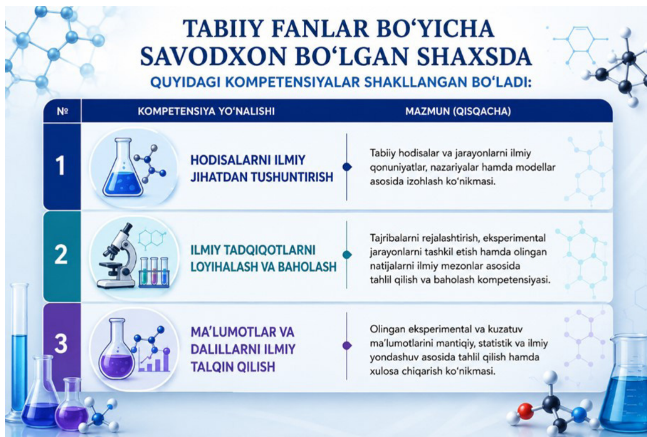
4-rasm: Tabiiy fanlar bo'yicha funksional savodxonlikning asosiy kompetensiyalari

Kimyo fanidan funksional savodxonlik – bu kimyoviy bilimlar, tushunchalar va ko'nikmalarni real hayotdagi muammolarni hal qilishda qo'llash, kundalik kimyoviy jarayonlarni tushunish, asosli qarorlar qabul qilish hamda fan va texnologiyaga oid masalalar yuzasidan samarali muloqot olib borish qobiliyatidir. U raqamli vositalar, interfaol tajribalar va nostandart testlar kabi strategiyalar orqali analitik fikrlashni, bilimlarni amaliy qo'llashni hamda kimyoni kundalik hayot bilan integratsiyalashgan holda o'rganishni rivojlantiradi. Mazkur yondashuv oddiy yodlashdan tashqari, amaliy muammolarni hal qilish ko'nikmalarini shakllantirishga alohida urg'u beradi.