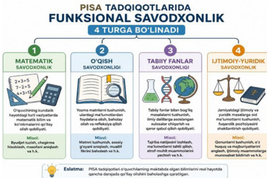
1-rasm: Xalqaro baholash PISA tadqiqotidagi funksional savodxonlik kompetensiyalari

Funksional savodxonlik insonning butun hayoti davomida shakllanadi, chunki inson faoliyatining barcha sohalarida yangi bilimlar, tushunchalar, qoidalar va me'yorlarni o'zlashtirish zarurligini anglab yetadi. Hozirgi globallashtirish va axborot texnologiyalari jadal rivojlanayotgan sharoitda funksional savodxonlik insonning ijtimoiy, madaniy, siyosiy hamda iqtisodiy jarayonlarda faol ishtirok etishini ta'minlovchi muhim omillardan biri sifatida tobora katta ahamiyat kasb etmoqda. Shu nuqtayi nazardan, funksional savodxonlik insonning tashqi muhit bilan samarali muloqotga kirishishi, unga tezkor moslashishi hamda mavjud sharoitlarda samarali faoliyat yurita olish qobiliyati sifatida talqin etiladi. Xalqaro baholash dasturi – Programme for International Student Assessment tadqiqotlarida funksional savodxonlik quyidagi tarkibiy qismlar asosida o'rganiladi.