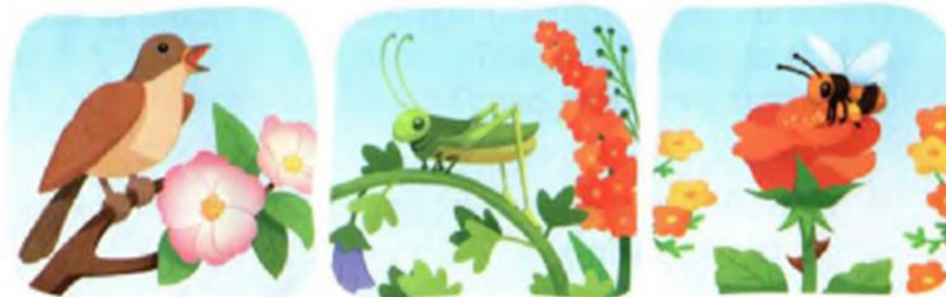
1-rasm: Kreativlik, kommunikativlik

2-mashq. Rasmlarga qarang. Ular asosida bir nechta gap tuzing.