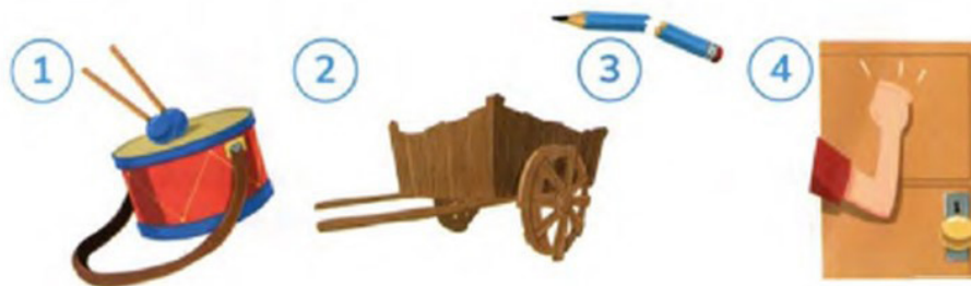
2-rasm: Kreativlik, kollobaratsiya

4-mashq. Tovushlarni harflar bilan ifodalashga harakat qiling.