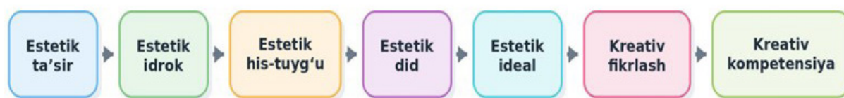
1-rasm: Estetik rivojlanishdan kreativ kompetensiyaga o'tish modeli

Estetik jihatdan rivojlangan shaxs obyektlar o'rtasidagi yashirin bog'lanishlarni tezroq payqaydi, assotsiativ fikrlaydi va bu uning intellektual faolligini oshiradi (1-rasm).