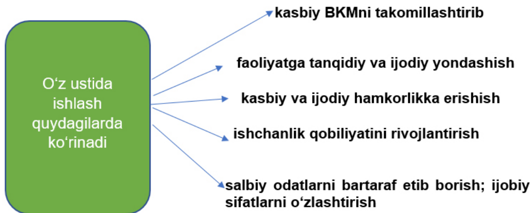
2-rasm: O'z ustida ishlashning namoyon bo'lishi